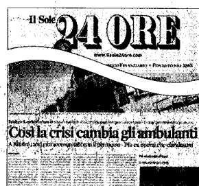
Gli ambulanti abusivi della Riviera e la crisi, sul Sole 24 Ore di domenica 19 luglio.