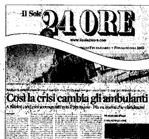
Gli ambulanti abusivi della Riviera e la crisi, sul Sole 24 Ore di domenica 19 luglio.