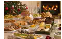
Mangiare senza ingrassare, a Natale si può