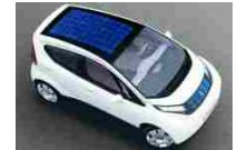
Auto a energia solare percorre 3.000 km in 4 giorni