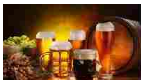
La birra italiana piace a tutto il mondo (export + 17%) In "Food"