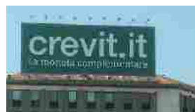
Moneta complementare, Crevit al 100% made in Italy In "People"