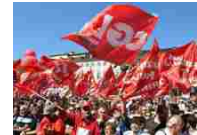
Lavoro, la Cgil si affida alla Regione