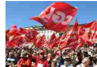
Lavoro, la Cgil si affida alla Regione