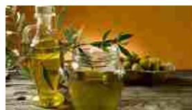
Falso olio "made in Italy", sequestri per 13 milioni In "Chronicles"